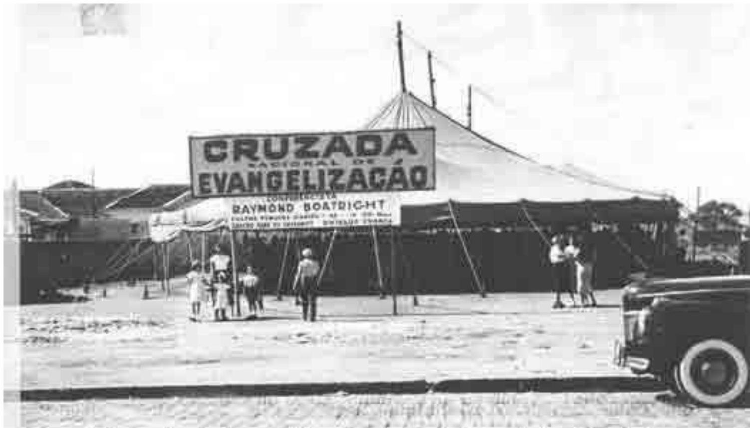
Primeira tenda da cruzada no Brasil, montada em Cambuci São Paulo

Um dos maiores movimentos de avivamento que o Brasil já viu, denominado Cruzada Nacional de Evangelização, o qual se iniciou na cidade de São Paulo, espalhando-se depois por todo o território nacional. O movimento utilizava tendas para a realização de suas reuniões, dava ênfase à cura divina e difundia o lema "Jesus Cristo é o mesmo ontem, hoje e eternamente"